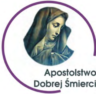
Apostolstwo Dobrej Śmierci

http://www.iskk.pl/images/stories/Instytut/dokumenty/Kult_MB_raport2016.pdf